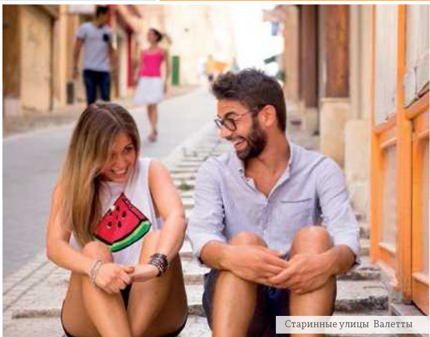
Старинные улицы Валетты