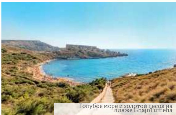
Голубое море и золотой песок на пляже Ghajn Iufneha