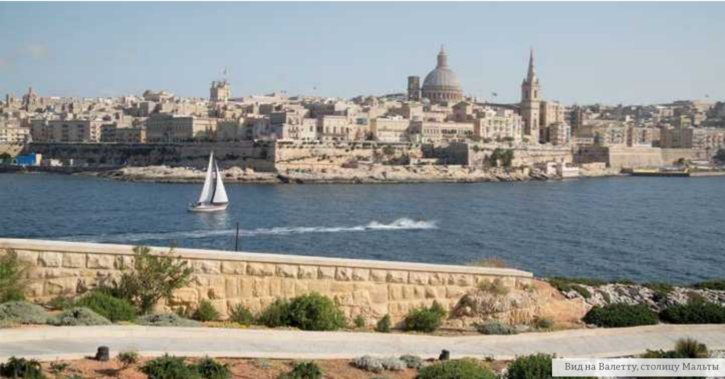
Вид на Валетту, столицу Мальты